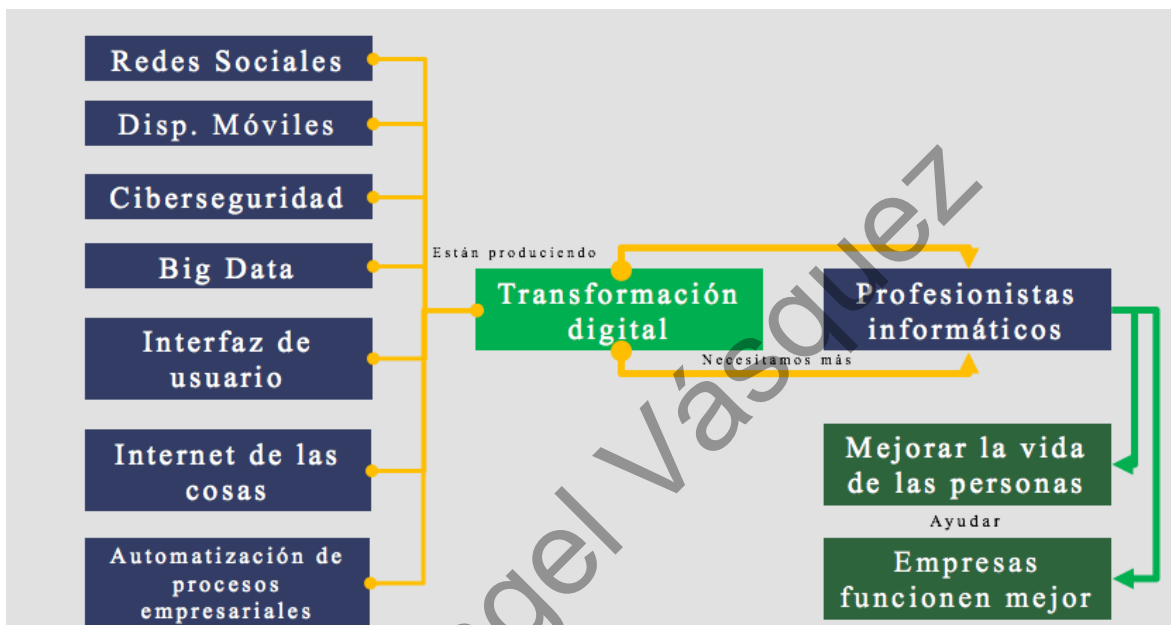
Figura 1. Transformación digital que se está produciendo en el mundo.

Dicho lo anterior, en México y en el mundo está ocurriendo un gran cambio, ya que se está produciendo la gran transformación digital (Figura 1). Necesitamos más profesionales informáticos que sepan aprovecharlas para mejorar la vida de las personas y ayudar a que las empresas funcionen mejor. Chicas y chicos con ganas de ser protagonistas en el gran cambio y que, desde su profesionalidad, sean los magos del siglo XXI.